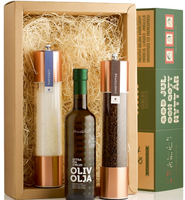
Jullåda 2015 Gourmet. Presentlåda i papp. Innehåller två gourmetkvarnar i koppar med havssalt och svartpeppar. Samt en extra jungfruolivolja ur Fam. Labardis Selection [ART. NR. 1119].