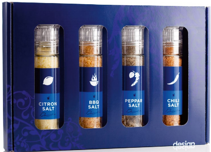
Designline presentlåda fyra salter. Innehåller citronsalt, BBQ-salt, pepparsalt och chilisalt [ART. NR. 1262].