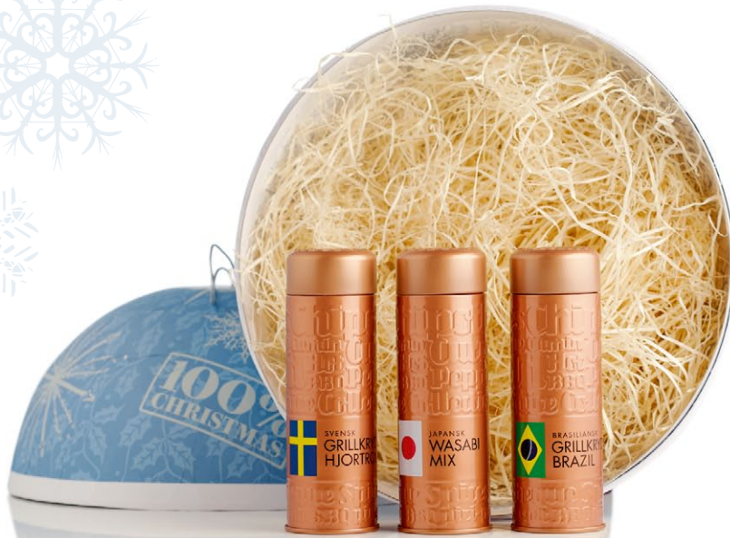
Designline julkula med plåtburkar. En julkula med tre plåtburkar som innehåller noga utvalda kryddor från olika delar av världen [ART. NR. 1107].