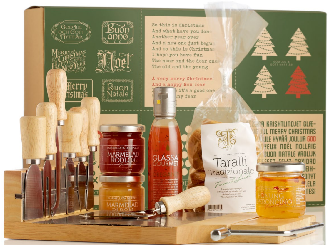
Ostlåda Deluxe. Denna papplåda innehåller en ostbricka i trä och metall. Fem olika ostknivar med träskaft, smaksatt glassa och honung. Päronmarmelad, lökmarmelad och taralli ur Fam. Labardis Selection [ART. NR. 1111].

är har vi valt att göra förpackningen till ett julstöksplus! Gåvor som i sig är en överraskning med fantastiskt goda kryddor oljor samt marmelader och ostbrickstillbehör! Sen är det bara att plocka fram sax och penna! Klipp ut julkorten och börja skapa, skicka till nära och kära. Finns väl ingen som inte uppskattar att få ett fysiskt kort i brevlådan i dessa elektroniska tider!