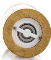
Kvarnverk i stål