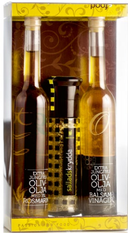
Fam. Labardi olivoljor & kryddkvarn. Innehåller en kryddkvarn med salladskrydda och två valfria olivoljor [ART. NR. 1131].