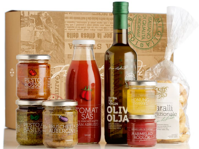
Jullåda 2015 Fam. Labardi. Innehåller pesto rosso, pesto al basilico, smaksatt honung, marmelad, taralli, bruchetta, tomatksås, jungfruolivulja och taralli [ART. NR. 1118].