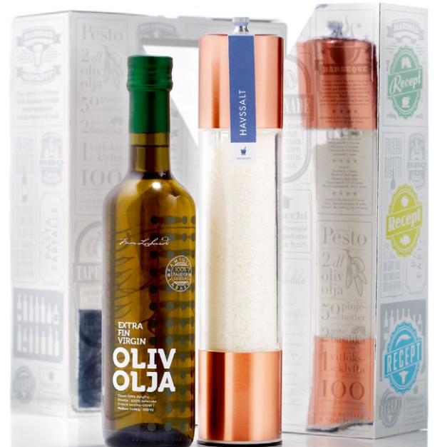
Receptlåda Classic. Innehåller gourmetkvarn i koppar med havssalt och en Fam. Labardi jungfruolivolja Classic [ART. NR. 1115].