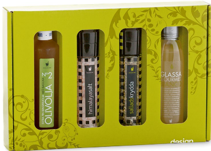
Designline salladskryddor. Innehåller smaksatt jungfruolivolja, glassa och två kryddkvarnar [ART. NR. 1261].