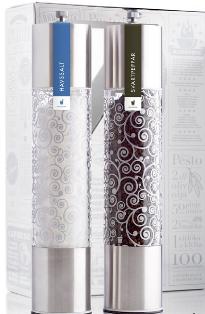
Receptlåda Steel. Innehåller två gourmetkvarnar i stål, havssalt och svartpeppar [ART. NR. 1146].