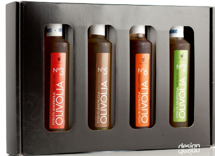
Designline presentlåda olivolja. Fyra olika jungfru-olivoljor med smak av citron, piri-piri, tryffel och basilika [ART. NR. 1257].