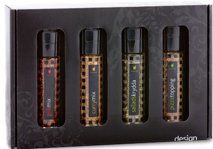
Designline kvarnlåda. Innehåller fyra stycken kryddkvarnar [ART. NR. 1260].