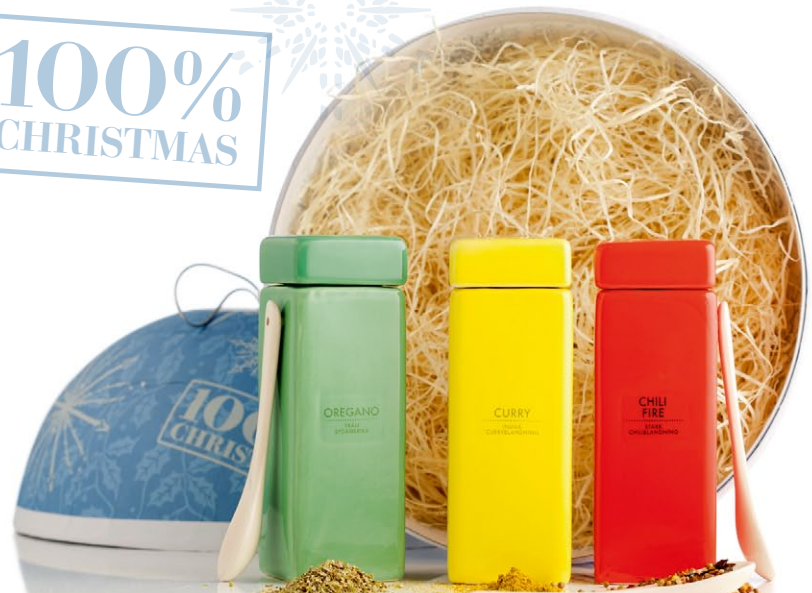
Designline julkula med keramik. En härlig julkula med tre stycken keramikburkar som innehåller noga utvalda kryddor och keramiksked [ART. NR. 1108].