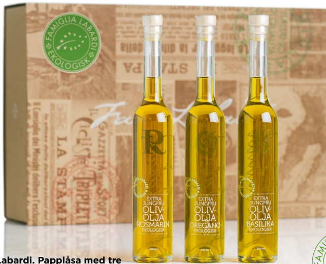
Fam. Labardi. Papplåsa med tre ekologiska olivoljor. En presentförpackning i papp med tre smaksatta ekologiska jungfruolivuljor, basilika, rosmarin och oregano [ART. NR. 1152].