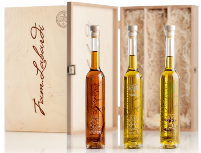
Fam. Labardi. Trälåda med 3 olivoljor. Present i naturträ med tre glasflaskor valfritt ur Fam. Labardi Selection [ART. NR. 1143].