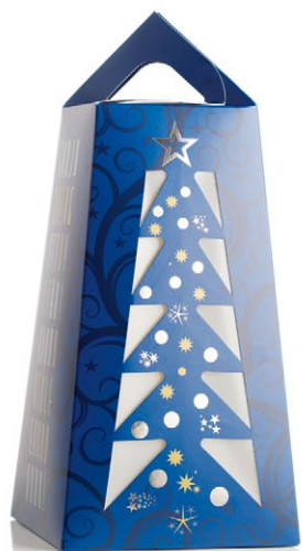
Julgransförpackning / ljuslykta.