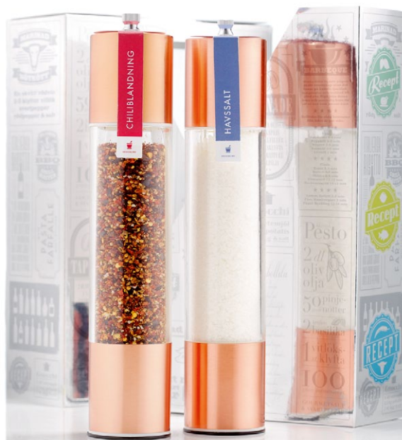
Receptlåda Kopper. Innehåller två gourmetkvarnar i koppar med havssalt och chilifire explosion [ART. NR. 1114].