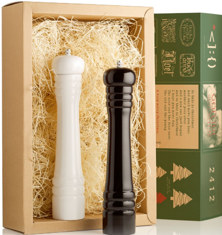
Jullåda 2015 Classic. En ordentlig papplåda med två klassiska tråkvarnar som innehåller havssalt och svartpeppar [ART. NR. 1112].