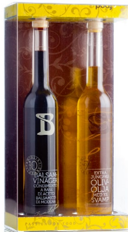
Fam. Labardi olivoljor. Innehåller två valfria olivoljor eller balsamico ur Fam. Labardi Selection [ART. NR. 1102].